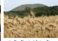
▲ 五島産はだか麦圃場の視察