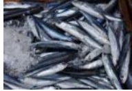
平戸・生月産飛魚漁場の視察