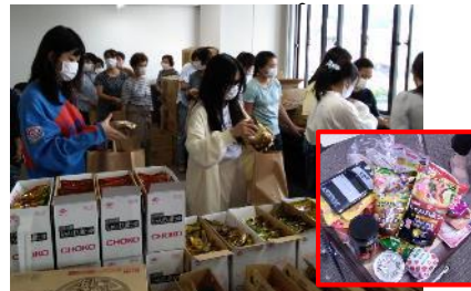
▲ ひとり親家庭等の支援団体に商品提供

食品メーカーとして、「まだ食べられる」を出来るだけ食卓へお届けしようとの考えから、子ども食堂やフードバンク等への提供を始めました。食品を大事に扱い、フードロスの削減に努める事は、80年にわたる企業活動の中で培ってきた「安心・安全な商品をお届け、人々を笑顔にしたい」という思いにもつながります。