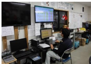
【販売管理モニター】