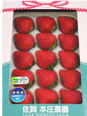
佐賀 本庄農園 SAGA HONJOYO FARM 佐電工(株)(佐賀県) 佐賀市ふるさと納税返礼品