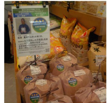
(同) ベジファームマツダ(宮崎県) JAみやざき直売所「ひなたマル シェ生目四季の丘」で販売