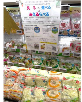
Bunkou Farms 島原(長崎県) エレナ各店舗(長崎県、佐賀県)で販売