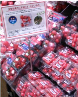
グリーンライフ熊本(熊本県) イオン九州各店舗で販売