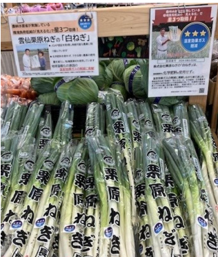
(株) 栗原ねぎ(長崎県) 直売所 大地のめぐみ(長崎県) で販売