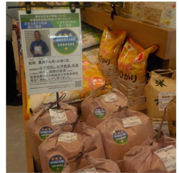
(同)ベジファームマツダ(宮崎県) JAみやざき直売所「ひなたマル シェ生目四季の丘」で販売