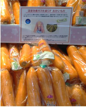
ふる里会(熊本県) イオン九州各店舗で販売