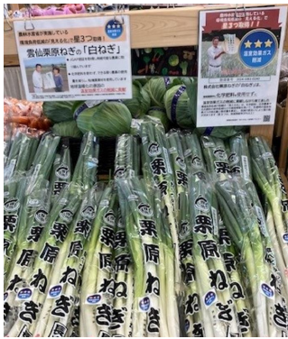
(株) 栗原ねぎ(長崎県) 直売所 大地のめぐみ(長崎県) で販売