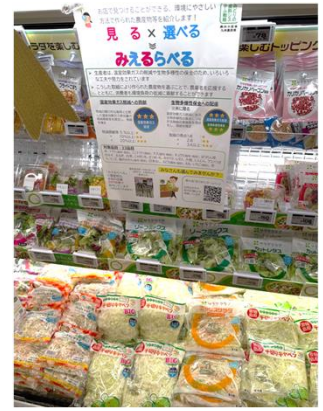
Bunkou Farms 島原(長崎県) エレナ各店舗(長崎県、佐賀県)で販売