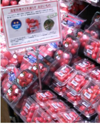
グリーンライフ熊本(熊本県) イオン九州各店舗で販売