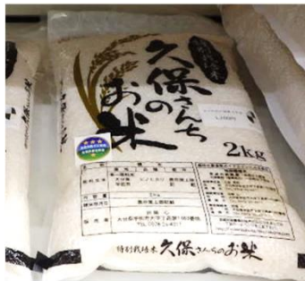
久保さんちのお米(株)(大分県) デイリーヤマザキ大分曲店 (大分県)などで販売