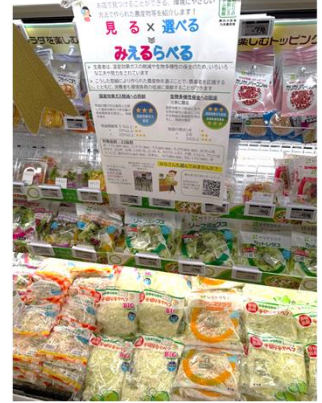
Bunkou Farms 島原(長崎県) エレナ各店舗(長崎県、佐賀県)で販売