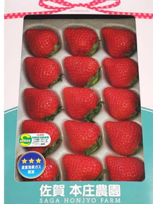
佐賀 本庄農園 SAGA HONJO FARM 佐電工(株)(佐賀県) 佐賀市ふるさと納税返礼品