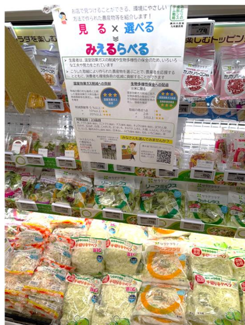
Bunkou Farms 島原(同)(長崎県) エレナ各店舗(長崎県、佐賀県)で販売