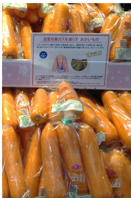
ふる里会(熊本県) イオン九州各店舗で販売