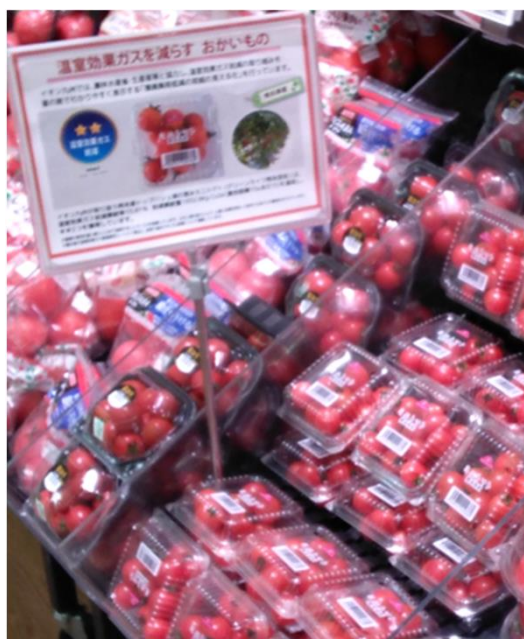
グリーンライフ熊本(熊本県) イオン九州各店舗で販売