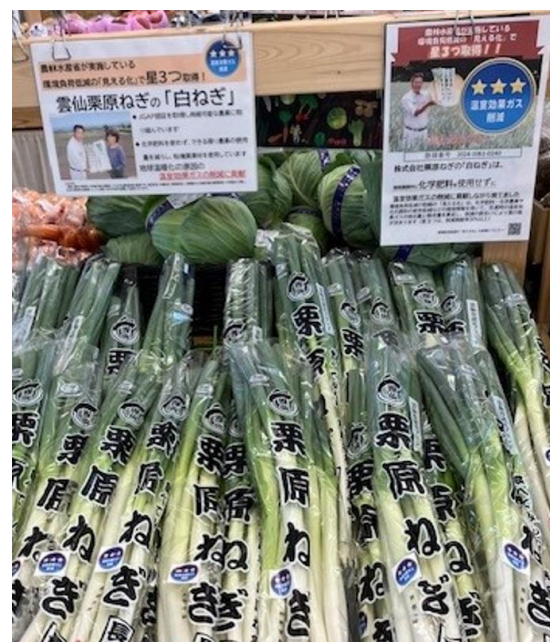
(株)栗原ねぎ(長崎県) 直売所 大地のめぐみ(長崎県)で販売