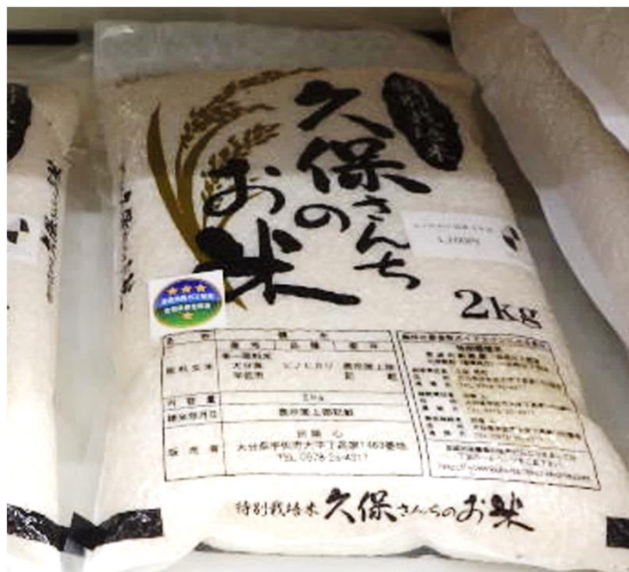
久保さんちのお米(株)(大分県) デイリーヤマザキ大分曲店(大分県)などで販売