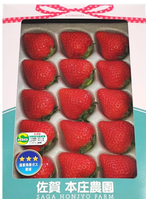
佐電工(株)(佐賀県) 佐賀市ふるさと納税返礼品