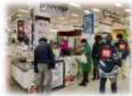
▲日南初かつおフェア

市内漁協は、水揚げされたかつおを日南産が記載された統一パッケージで出荷するとともに、鮮度保持の取組みを行っている。 また、日南かつお一本釣りシステムの認知度向上・価値向上を図るため、市内外で開催される農業遺産関連イベントへの出展を行っている。