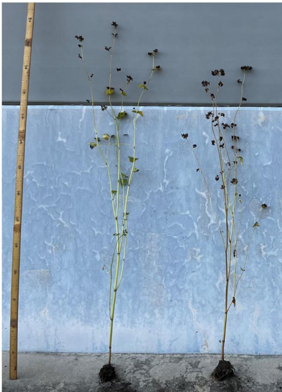
従来品種 (常陸秋そば) はるかみどり