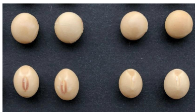
フクユタカ そらみのり 子実の外観