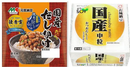
「そらみのり」を原料にした 納豆が販売されています。