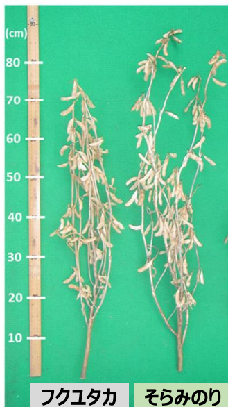
フクユタカ そらみのり