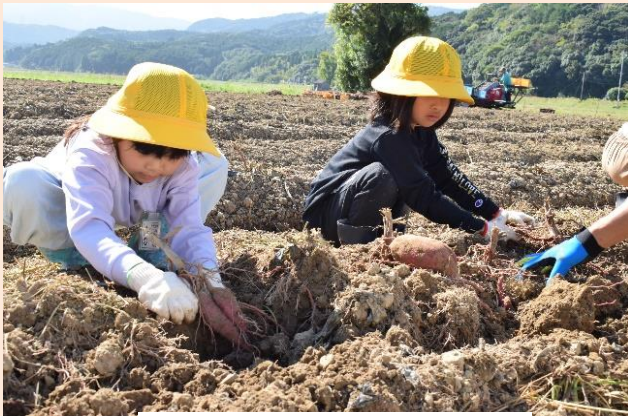
さつまいも収穫体験

地域資源を活かした体験事業を通じて、子ども達に地域産業の魅力を知ってもらうことを目的に「有明町収穫体験」を実施している。