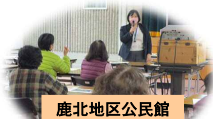
鹿北地区公民館 令和4年12月8日