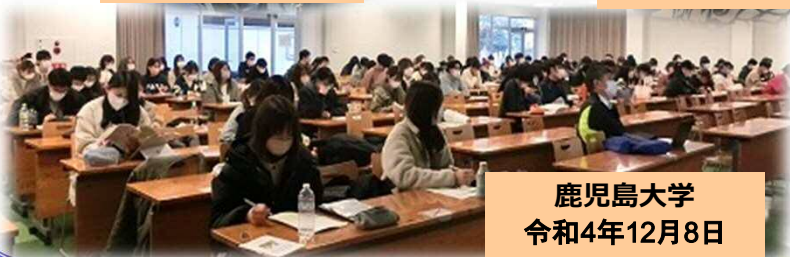
鹿児島大学 令和4年12月8日