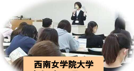
西南女学院大学 令和4年11月25日