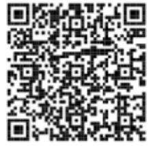
「ようこそ消費者の部屋へ」