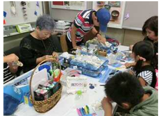
貝殻に色を塗ってマグネットを作りました (自由研究メニュー)