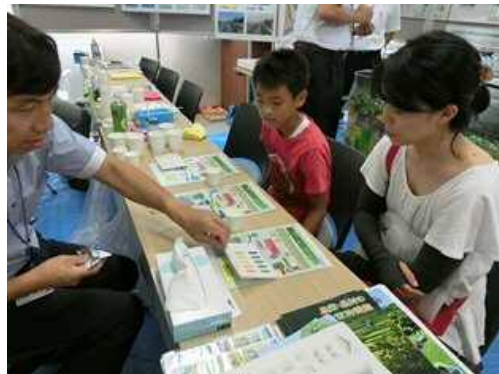
身近な水を調べました (自由研究メニュー)