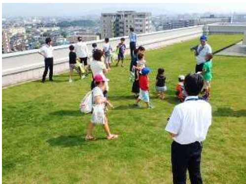
たてものをたんけんしました (応募型体験メニュー)