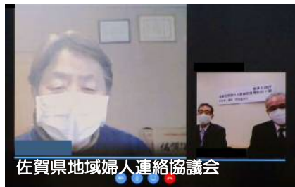
佐賀県地域婦人連絡協議会