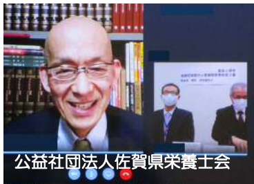
公益社団法人佐賀県栄養士会