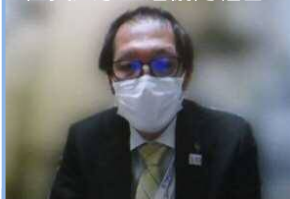
JA佐賀県女性組織協議会