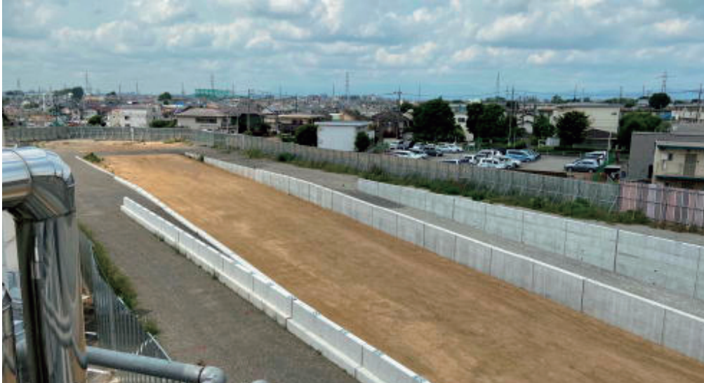
①総合検査棟から見た工事状況（次ページ建物等配置図の①からの景観）