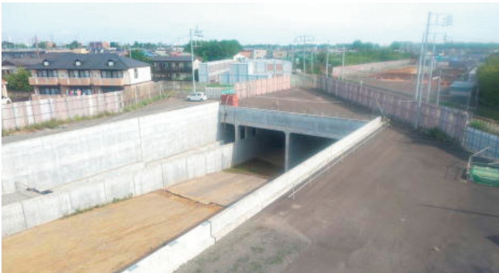
②総合検査棟から見た工事状況（次ページ建物等配置図の②からの景観）