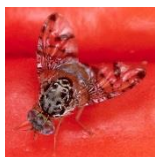
Средиземноморская плодовая муха

*Помимо этого, запрещен ввоз большинства растений из стран и регионов, где причиняют значительный ущерб насекомые-вредители, которые не водятся в Японии. За подробной информацией обращайтесь в Японскую службу защиты растений.