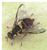
Азиатская плодовая муха