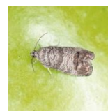
Яблоневая плодовая муха