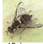
ओरिएंटल फल मक्खी