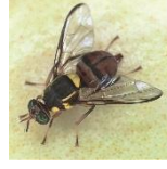
ওরিয়েন্টাল ফলের মাছি