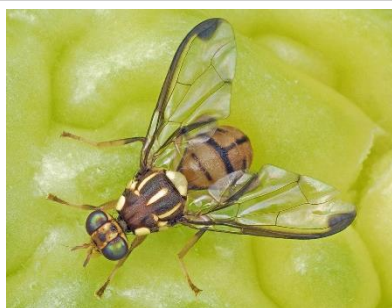
セグロウリミバエ成虫（体長8～9mm）