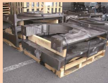
⑨木製のパレット+当て木