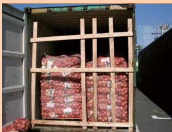
⑧留め木 (wooden peg)