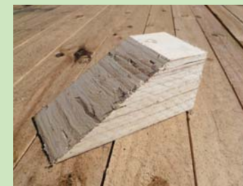
①LVL (laminated veneer lumber) を使用したクサビ(留め木)