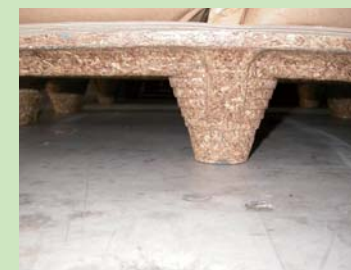
③パーティクルボード (particleboard) を使用したスキッド