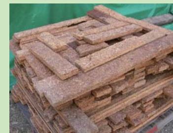
⑤パーティクルボード (particleboard) を使用したダンネージ