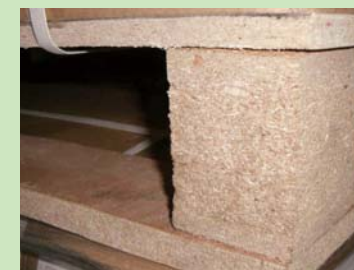
④パーティクルボード (particleboard) を使用したパレット