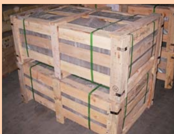
⑤木製のすかし箱 (wooden crate)