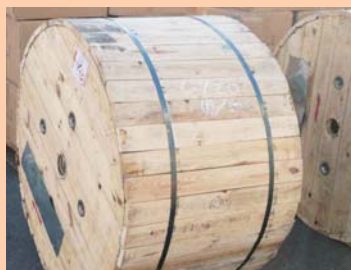
②木製のドラム (wooden drum)