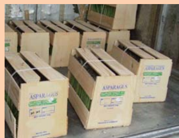
⑥木製のクレート (wooden crate)