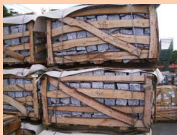
④木枠 (wooden crate)