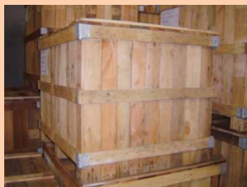
⑦木箱 (wooden box)