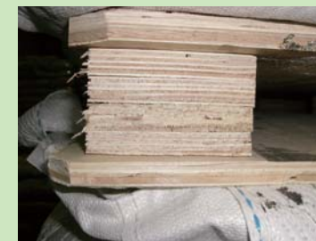
②合板 (plywood) を使用したパレット