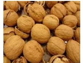
껍질 있는 호두