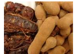
Quả me khô