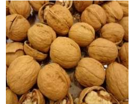
Quả óc chó có vỏ