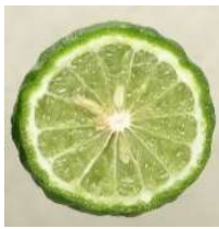
chủng loại cam quýt