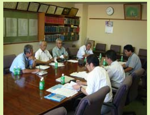
— 集落営農組織等に対するヒアリング —

また、品目横断的経営安定対策が、農地の利用集積や連担化、地域の作付体系にどのような影響を及ぼすかについても分析していきたいと考えています。