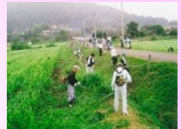
農地法面の草刈り