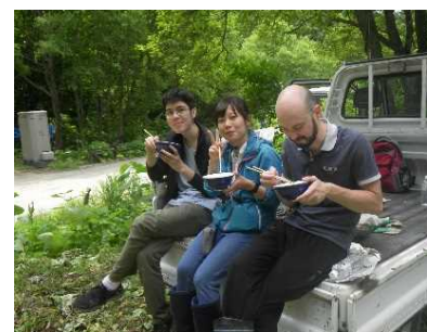
植木のボランティアで(米国、ロシア)