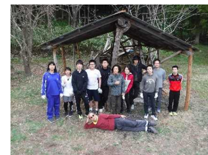
地元の高校生達と海外の大学生との交流