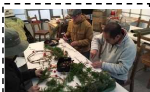
農業資源利用の リースづくり講座