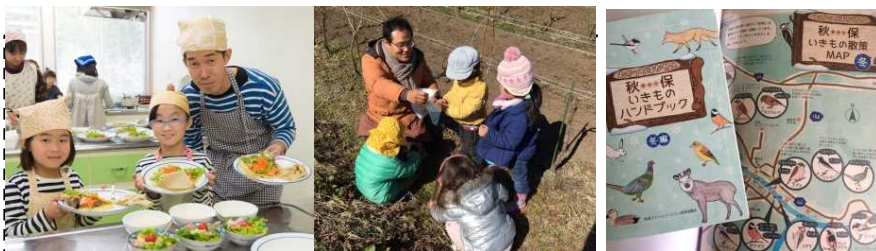
地元の蕎麦粉で料理教室 生きもの観察ワークショップ 生きものマップ制作