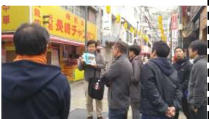
先進地視察の様子