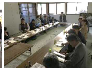
↑【写真2】第1回コンセプトミーティング(10/29)