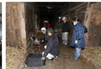
↑【写真3】耐震診断調査