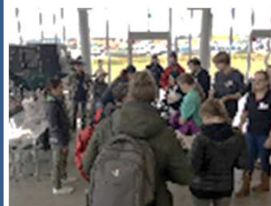
↑【写真1】インバウンドツアー