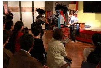
伝統芸能は観客の間近で行い、迫力を感じてもら