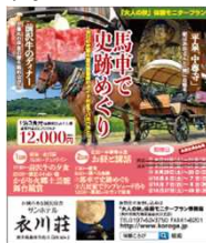
44万部発行のフリーペーパーへ広告を掲載