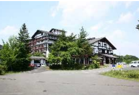
国民宿舎サンホテル衣川荘