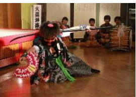
地域に伝わる伝統芸能