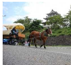
馬を観光資源として活用する取り組み