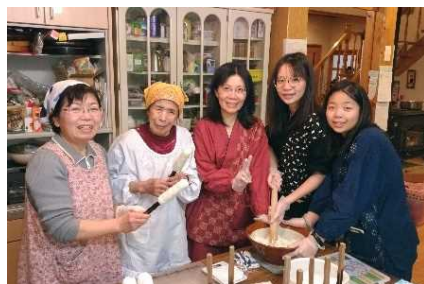
外国人モニター受入