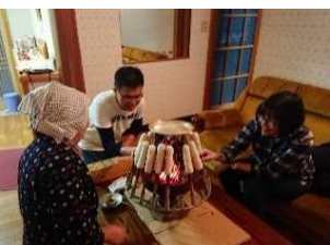
きりたんぽづくり体験