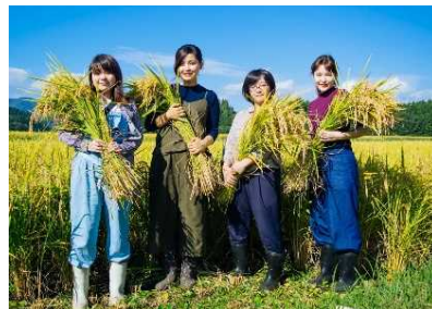
農村カメラガールズ受入