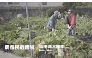
台湾ブロガー受入