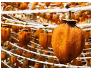
地域郷土料理あんぽ柿