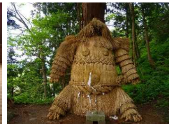
千年公園のかしま様