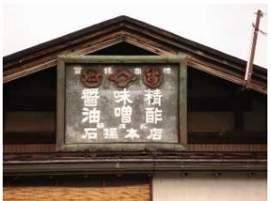
味噌醤油蔵が二軒現存