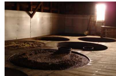
石孫本店の味噌蔵