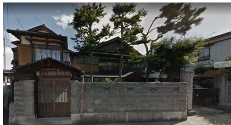
築120年の蔵を有す宿泊施設予定地