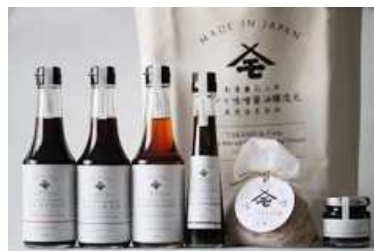
革新的な取り組みの発酵調味料

発あ本 酵き日 中た 。あきた発酵ツーリズム AKITA FERMENTATION TOURISM