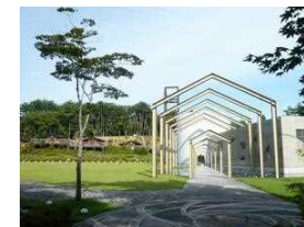
宮沢賢治の世界に触れる