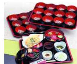
事業者による名物料理の提供 によって受入規模を拡大