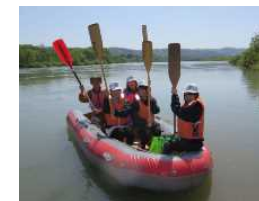
地域の事業者と連携した企画旅行商品を造成