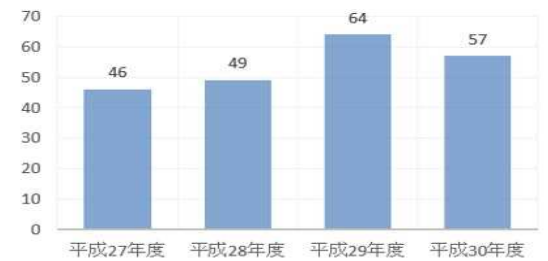
一般客受入実績(人)

教育旅行を除く一般分の受入れ人数は、全体として見れば増加傾向にあり、今後の伸びが期待できる。(H30は、受入家庭1軒で事故があり受け入れできなかったことから微減。)