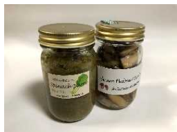
シイタケなど地場産品を活用した商品開発