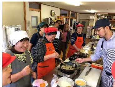
食商品開発に多くの女性が参画