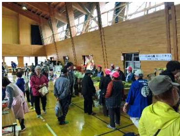
侍マルシェに2,350人が来場