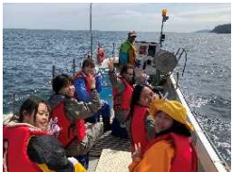
サッパ船体験などを組み合わせたツアー