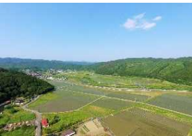
東和町の里山風景