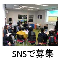
SNSで募集表参道でのPR活動