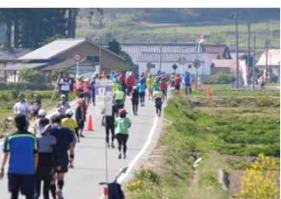
【川内の郷かえるマラソン大会】