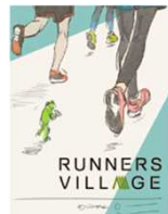
作成中のマップ(表紙)