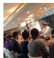
川内産野菜でのアスリート向けフレンチ試作