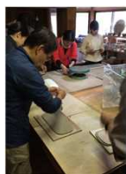
見学会での陶芸体験