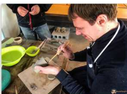
Un salto nel tempo a Marumori e Shiroishi Marumori è una cittadina in una circonvallazione circondata da montagne. Scoprire, dove si ha la possibilità di generare la vera cucina locale direttamente in casa propria. Si tratta di una famiglia giapponese che vi regala il suo stile di vita e la sua esperienza. Questa famiglia è proprietaria.