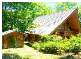
宿泊施設(温泉風呂付貸 切ログハウスNJ ZAO)