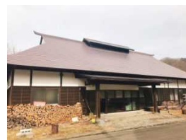
体験をうけいれている 山水苑(着付け体験)