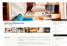
オンライン予約管理体制構築