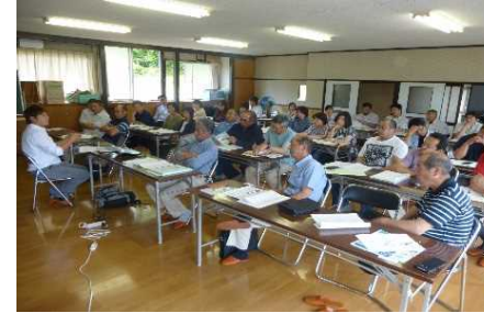
熱心に研修を深める地域住民