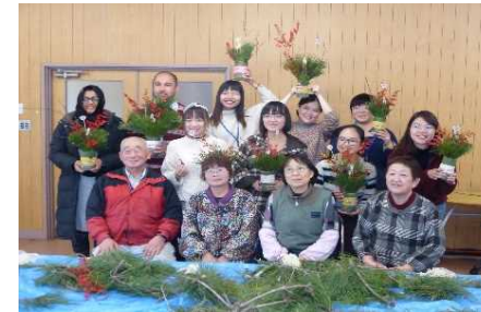
モニターツアーの様子