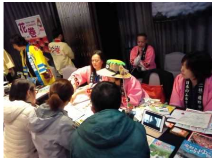
台湾・香港・タイ等における商談会出展