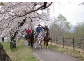
馬を活用した町づくり