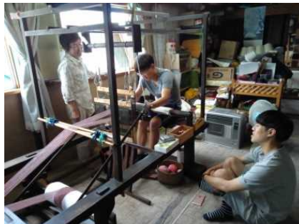
韓国人モニターが南部裂織の体験