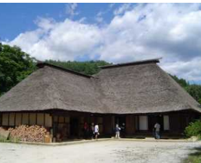
『遠野物語』の原風景