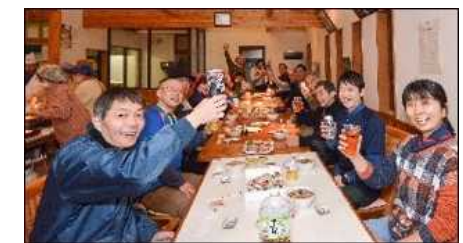
地域住民等の交流会