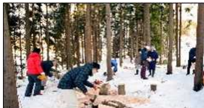
白神山地の麓できこり体験