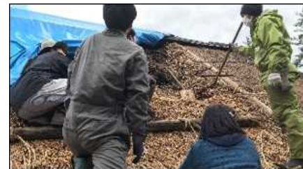
茅葺き屋根の葺き替え体験