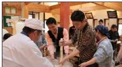
きりたんぽ&そば打ち体験