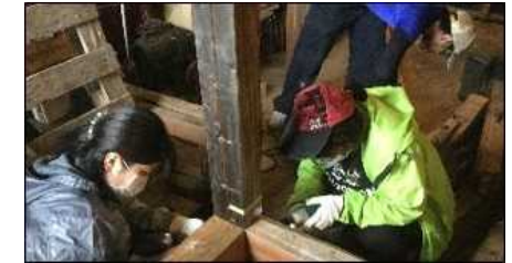
地域木材を使ったDIY体験