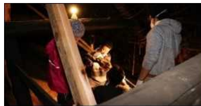
古民家の屋根裏部屋DIY体験