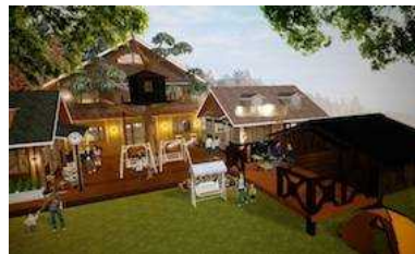
農場ゲストハウス構想を支援