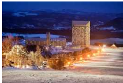
スキー場など豊かなアウトドア資源