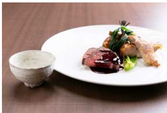
八幡平オーベルジュ