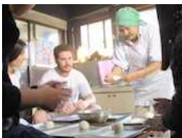
郷土料理づくり体験