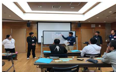
体験プログラム推進のための人材育成