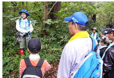
体験プログラム推進のための人材育成