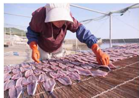
漁業体験プログラム