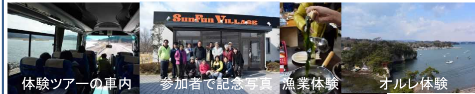
体験ツアーの車内