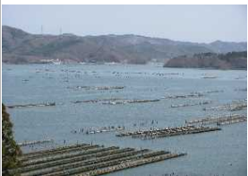
万石浦(牡蠣とノリ)