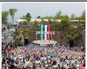
サンファン祭り(5月)