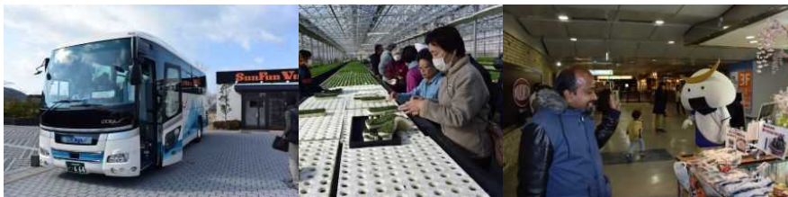
テストツアー (サンファンビレッジ前)