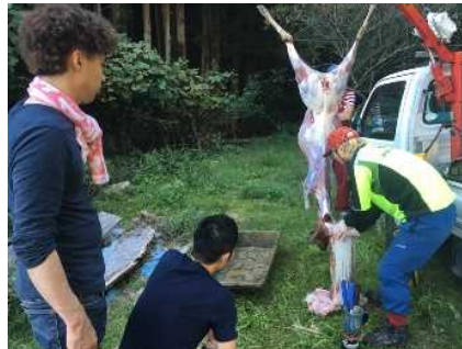
料理人と解体ワークショップ