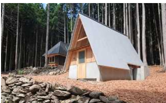
もものうらビレッジ