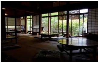
(一社)はまのね CAFÉはまぐり堂