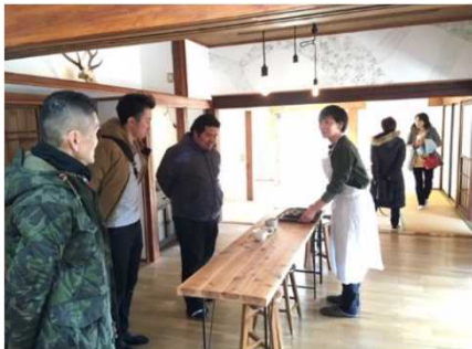
芸術と漁業の連携 (アート展)