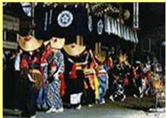
西馬音内盆踊り会館