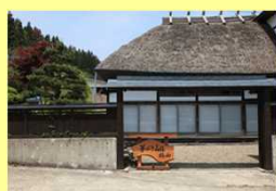
写真① 農泊を行う古民家