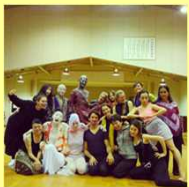
舞踏ワークショップ