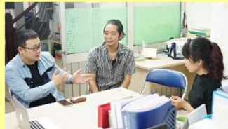
写真② アジア諸国での営業活動