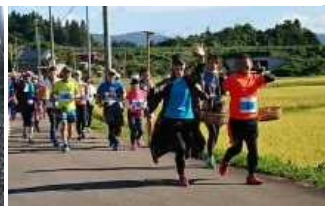
東和棚田のんびりRun