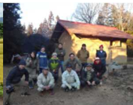
空き家リノベ活用