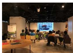
東京でのPRイベント