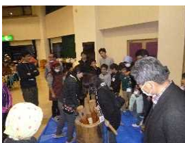
都会と地元の人との交流体験