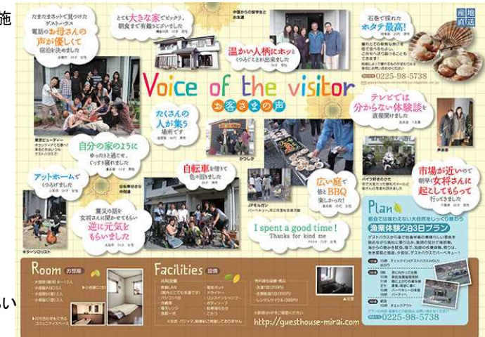
ゲストハウスみらい お客様の声