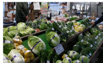
農産物直売所(ポケットファームおおせ)