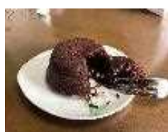
黒にんにく入りガトーショコラ