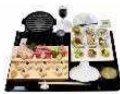
たっこにんにくを活用したガーリックステーキごはん