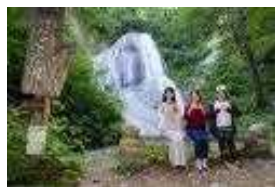
町の中心部から十和田湖に向かう途中にある「みろくの滝」