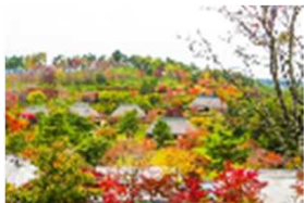
紅葉が美しいタプコブ創遊村