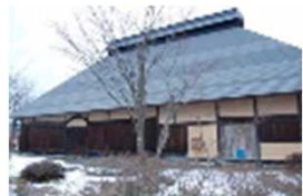
町の中心部に移築された民俗資料会