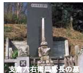
支倉六右衛門将長の墓