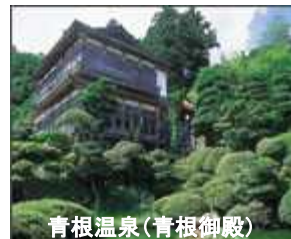
青根温泉(青根御殿)