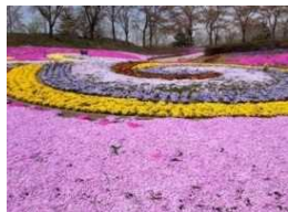
国営みちのく社の湖畔公園